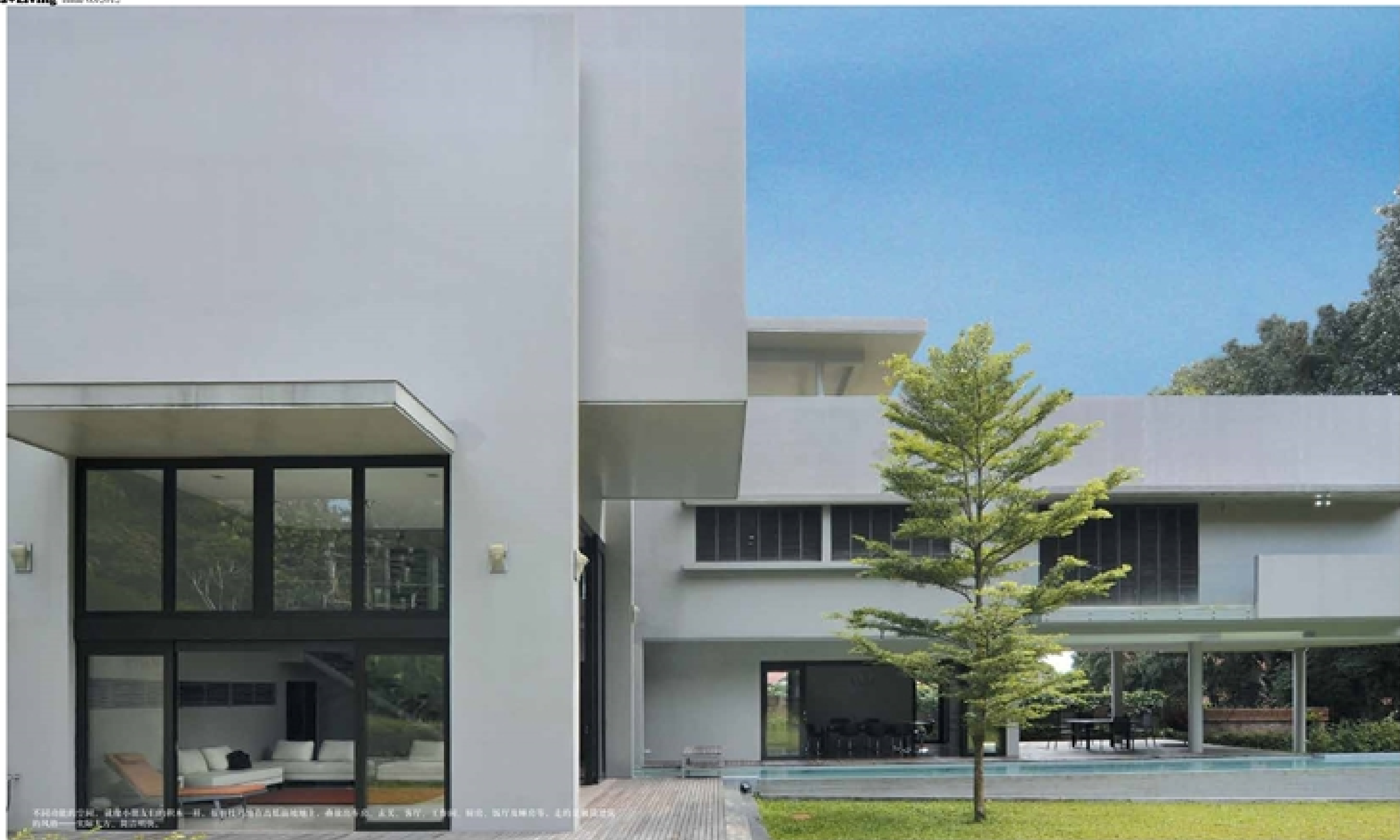
不同材质的对比，是设计师设计的一大特色。设计师在建筑立面设计中，采用了木材、石材、金属、玻璃等多种材质，通过材质的对比，营造出一种独特的视觉效果。