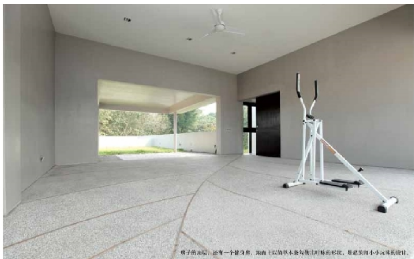
房子的面层，还有一个健身房，地面上以简单木条勾勒出呼吸的形状，是建筑师小小玩味的设计。