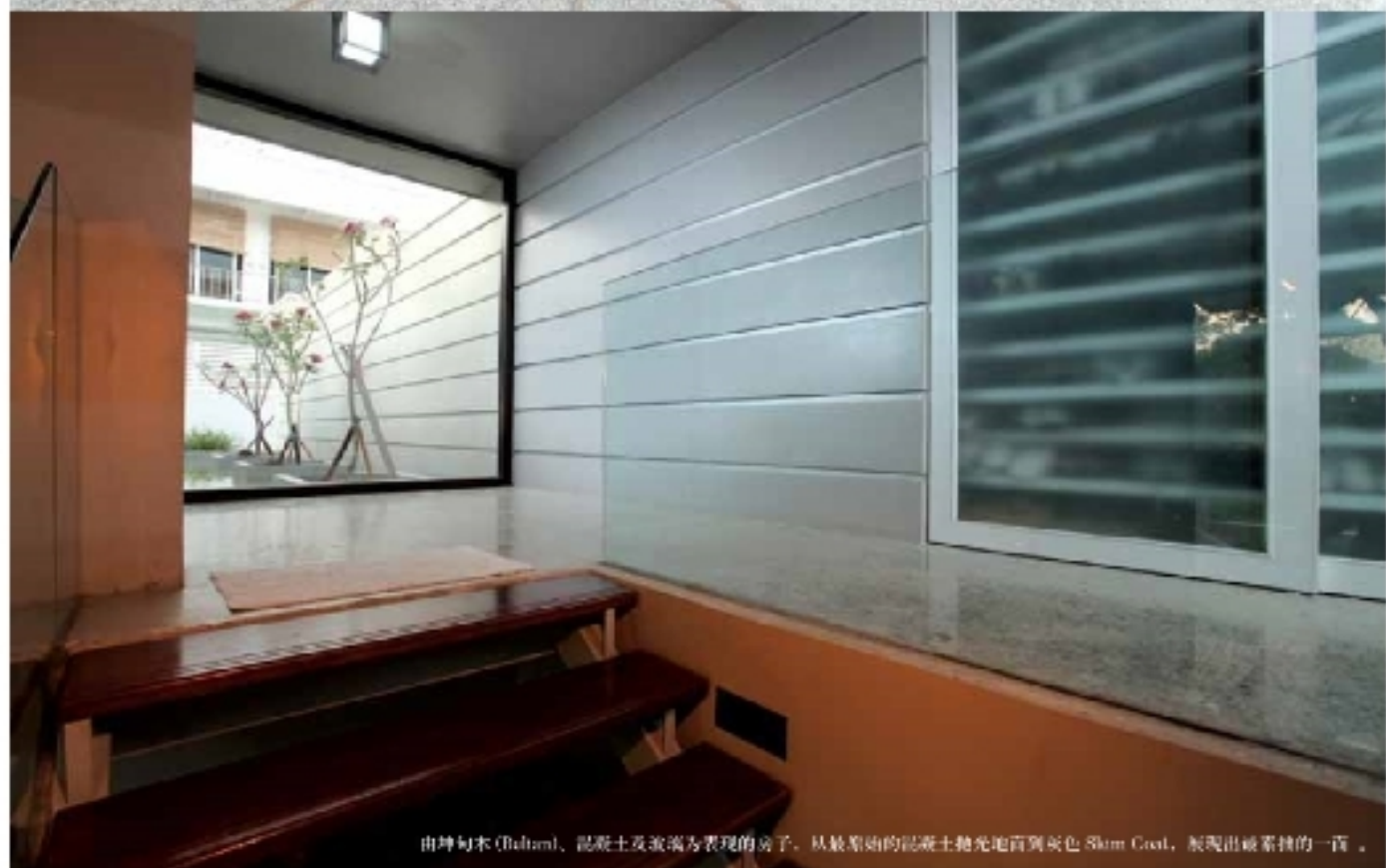
由坤甸木 (Bubun)、混凝土及玻璃为表现的房子，从最原始的混凝土抛光地面到灰色 Slim Coat，展现出最纯粹的一面。