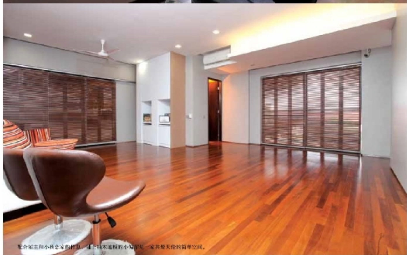
配合屋主和小孩子念家的作息，让上榻木地板的小编你是一家共整天伦的简单空间。