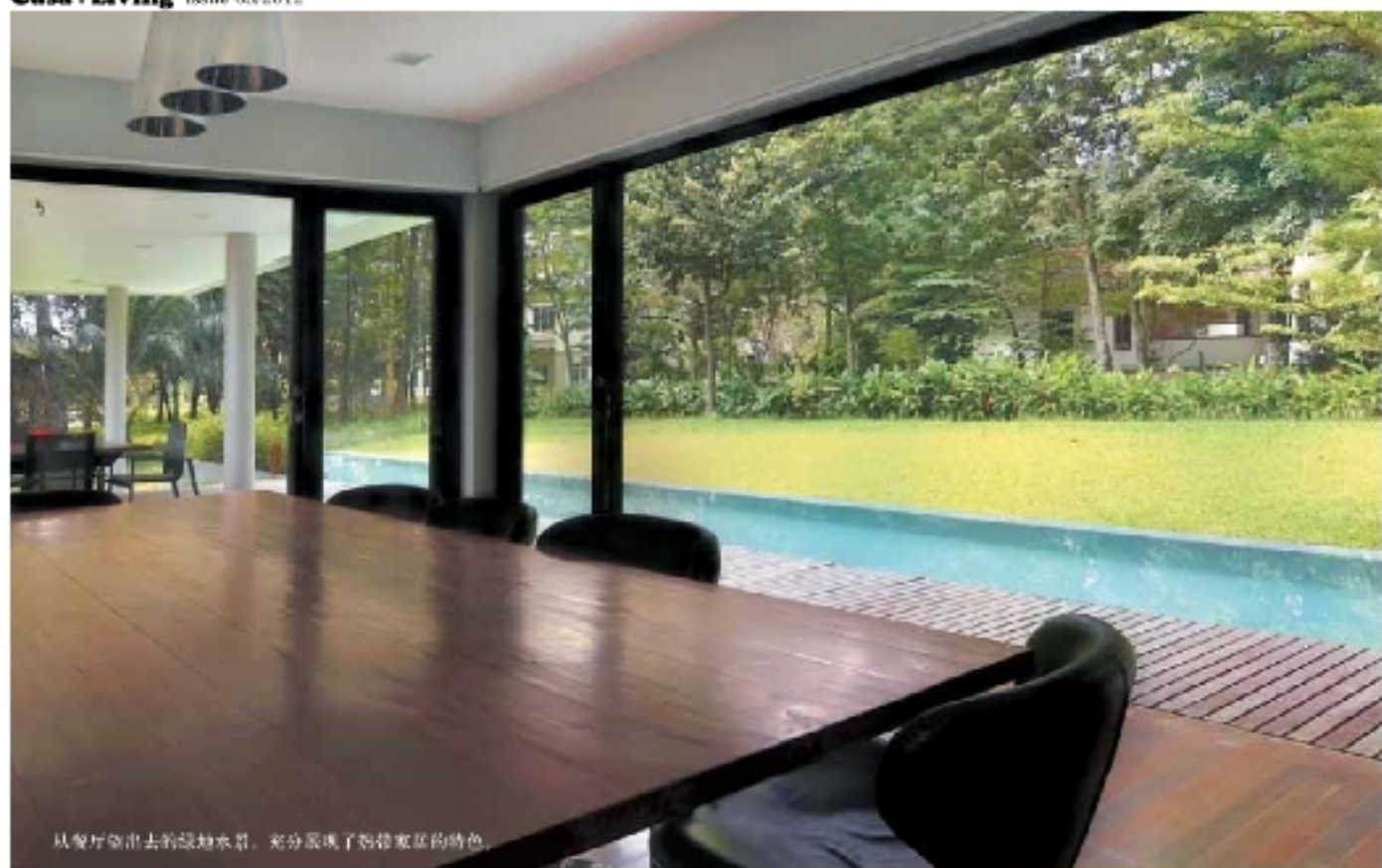
从餐厅望出去的绿地水景，充分展现了别墅家居的特色。